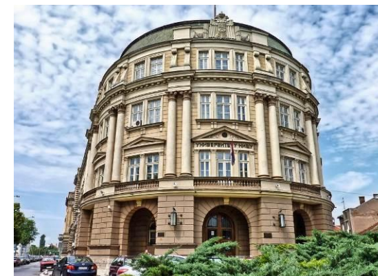
Универзитет у Нишу

УНИВЕРЗИТЕТ У НИШУ ГРАЂЕВИНСКО-АРХИТЕКТОНСКИ ФАКУЛТЕТ